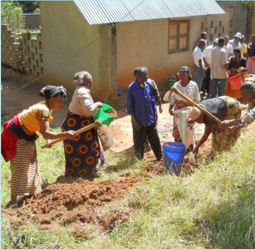
Vrouwen verzamelen zand voor het metselwerk