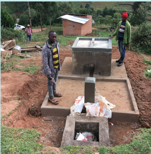
De 2 metselaars bij een net gebouwde kraan plus wastafel

Half mei ontvingen we het eerste voortgangsrapport . Daaruit blijkt dat het project al bijna voor de helft klaar is: 60% van de 9 km. hoofdleiding is gelegd, en 40 % van de 5,7 km. distributieleidingen. Van de 14 geplande tappunten zijn er 7 klaar, inclusief de kledingwastafels.