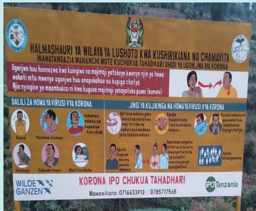
Voorlichtingsbord in het centrum van één van de 7 dorpen