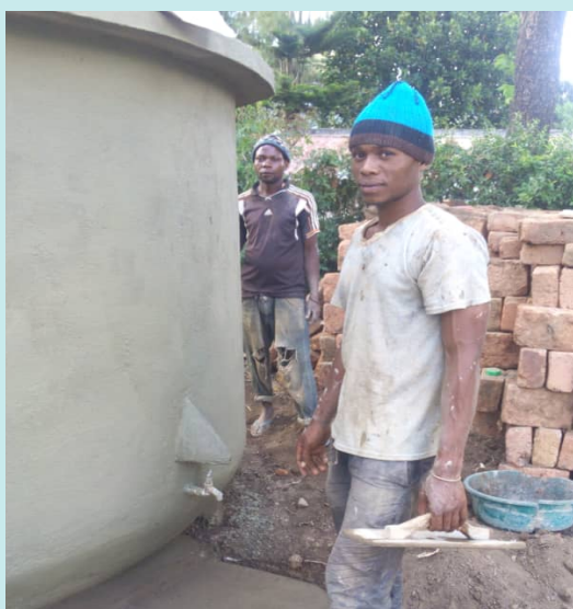
Laatste afwerking van een pas gebouwde tank