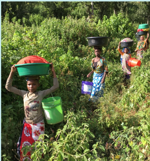
Vrouwen uit Kifuruga op de terugweg van de plek, waar ze nu nog water halen en kleren wassen (500 m. steil naar boven)