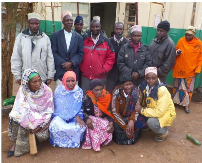
Een eigen kantoor in een container, waar het watercomité spullen kan bewaren en vergaderingen houden.