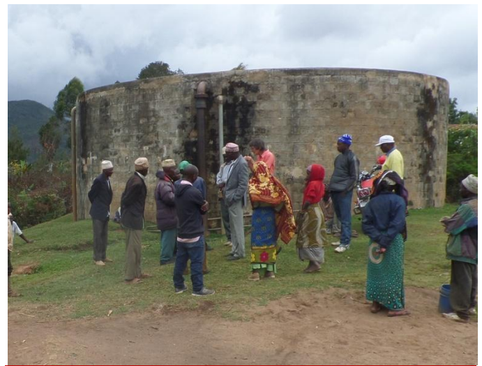
Overleg met de plaatselijke onderhoudsmonteurs.