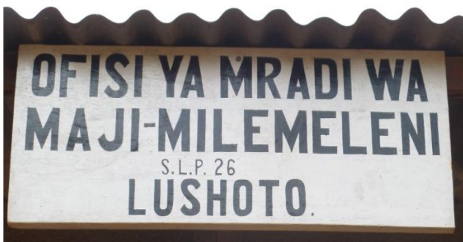
Een eigen kantoor in een gehuurd gebouwtje, waar de gebruikers hun bijdrage kunnen komen betalen.

Giften blijven welkom op bankrekening NL22ASN8800196756 t.n.v. SPOT Tanzania, Leimuiden.