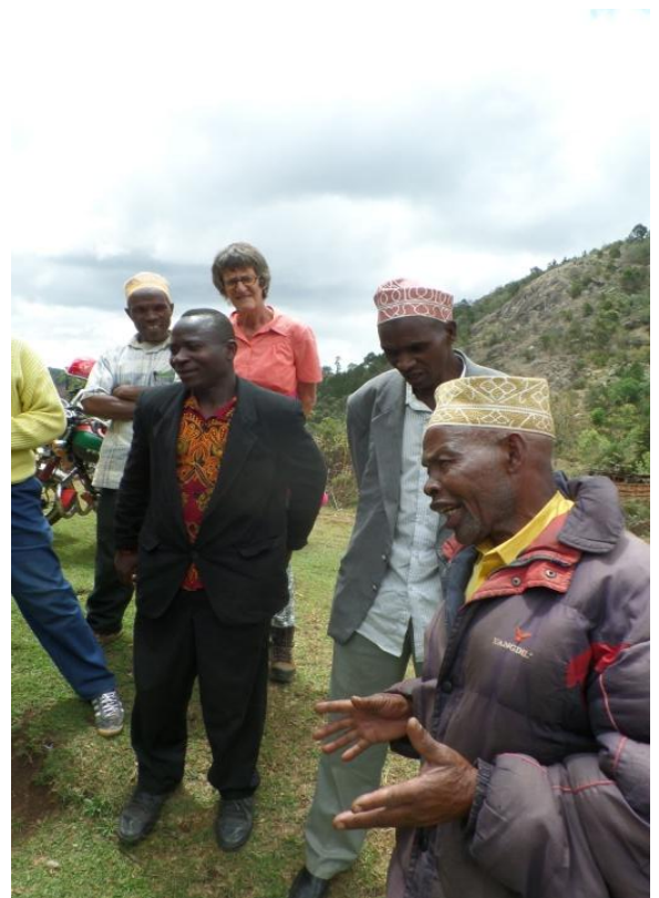
Overleg met gebruikers